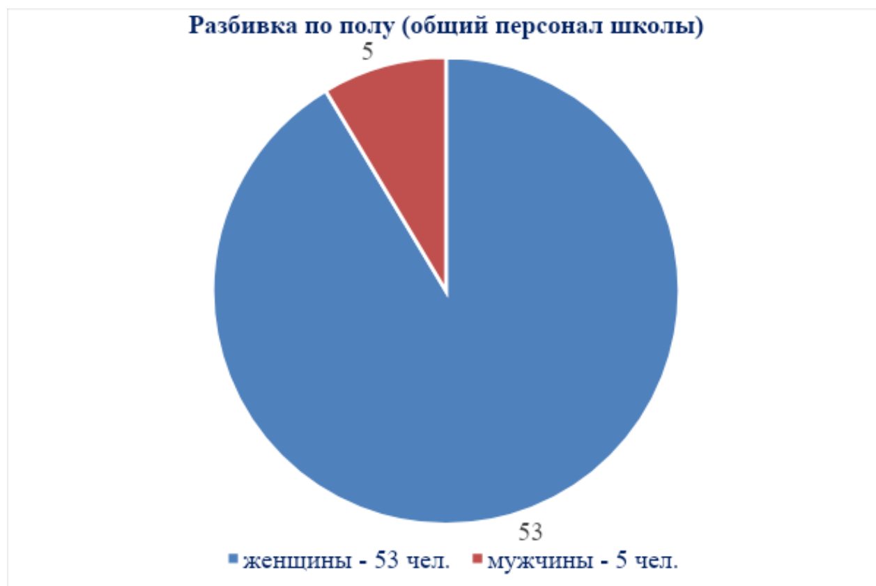
Таблица № 3