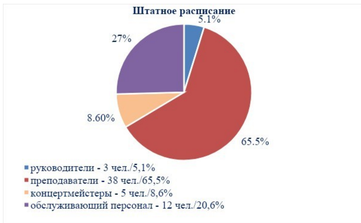
Таблица № 1

Персонал насчитывает 58 человека, в том числе – 3 административных, 43 педагогических и 12 технических работников.